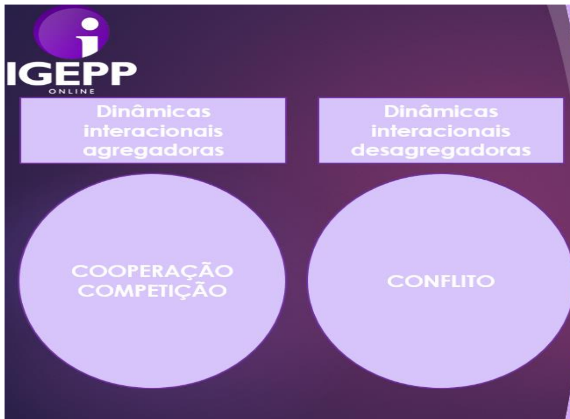
Figura 1: Dinâmicas interacionais nas sociedades modernas

Do ponto de vista estratégico, a coerção é uma alternativa de utilização restrita, já que, quanto mais utilizada, menor a sua efetividade e mais elevado resulta o seu custo. Resta, então, a política. A política envolve coerção em potencial, mas não se limita a ela. Ao contrário: admite vários outros mecanismos, destinados a tornar desnecessária a própria coerção.