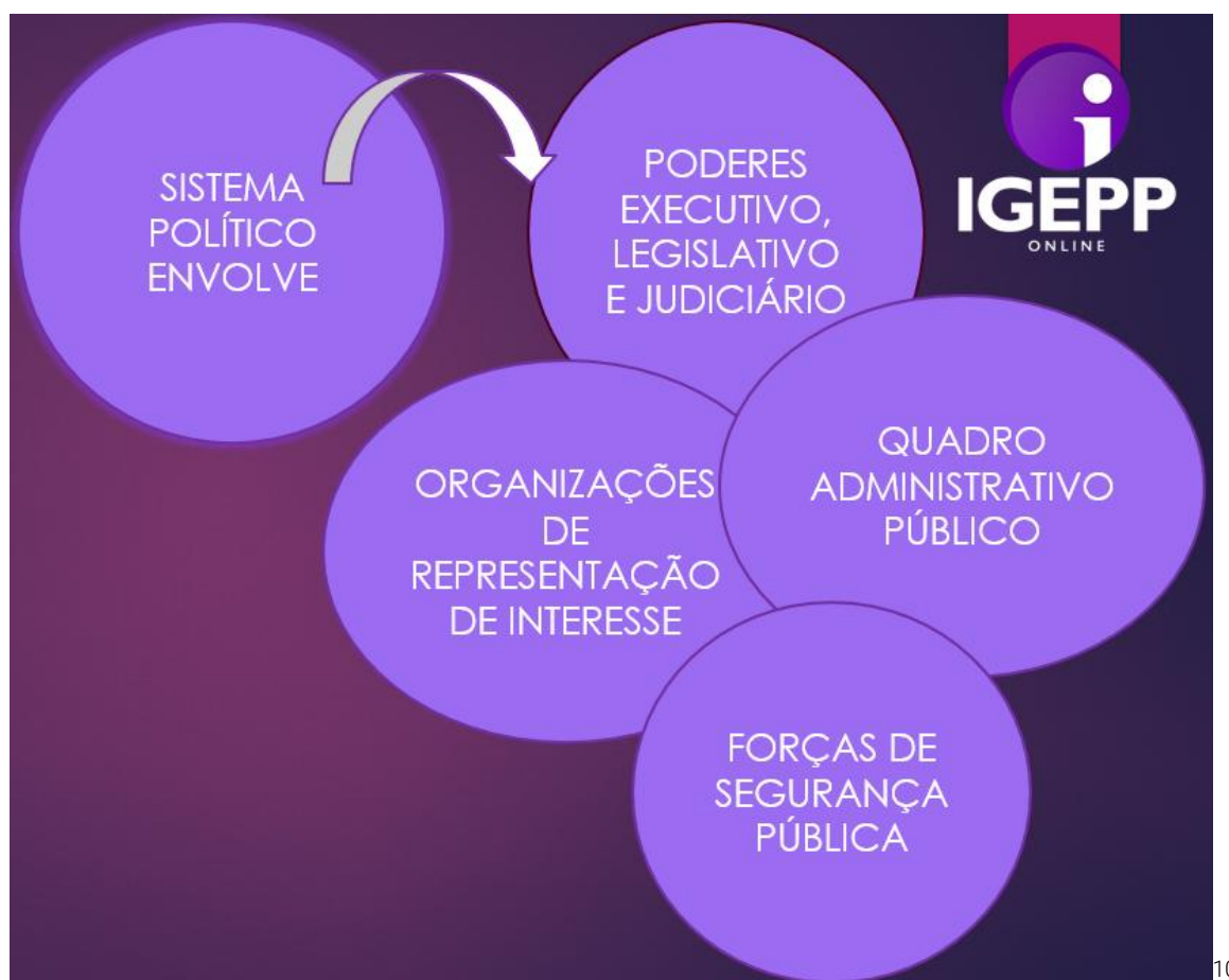
Figura 2: Elementos do Sistema Político

Na prática, o sistema político envolve os elementos da figura abaixo: