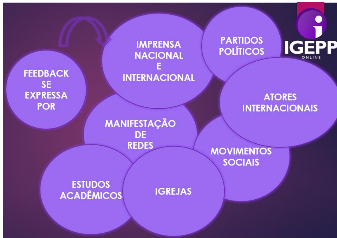
Figura 4: Canais de manifestação do feedback

Em síntese, os inputs mobilizam o sistema político, que os processa e produz outputs . Os outputs , por sua vez, suscitam modificações no ambiente (sistema nacional e demais sistemas). Isso gera feedback : retroalimenta o sistema em questão e produz outros inputs e withinputs (de demanda e/ou de apoio). Essa dinâmica é contínua, constante.