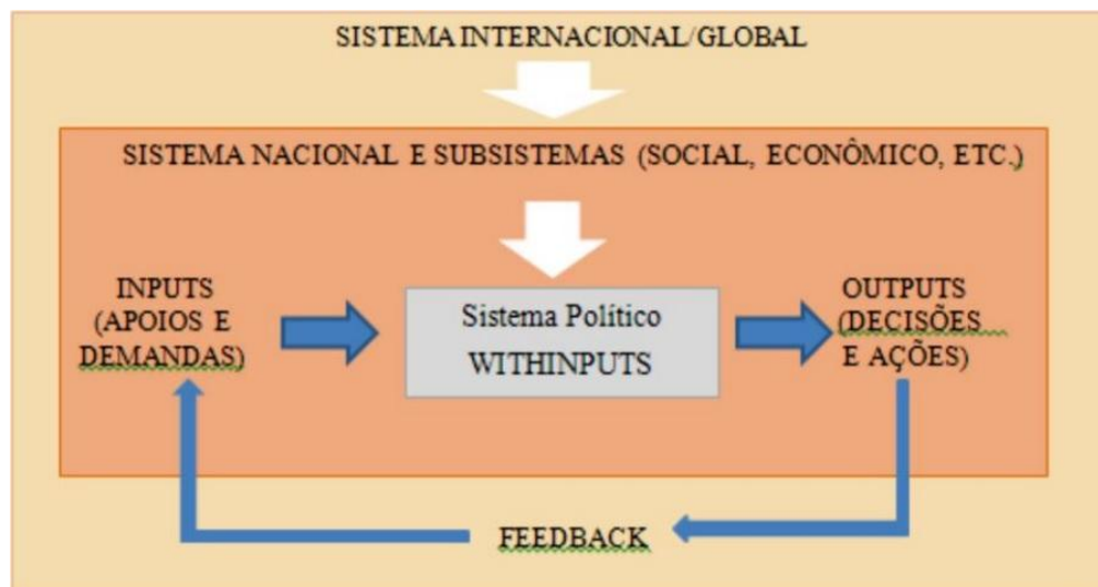
Figura 1: Dinâmica do Processo Político: Sistemas Múltiplos e Interativos

Para usar a linguagem de EASTON (1970), as políticas públicas provêm do processamento , pelo sistema político, de inputs originários do ambiente (sistema internacional-global e sistema nacional) e também de withinputs .